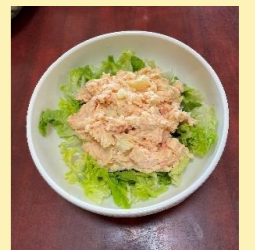
鶏肉の塩麴・大根と厚揚げ・たらこポテト

皆さんの声 「お昼ご飯、 美味しい!!!」 「バイキング は飽きなくて 良いね〜」