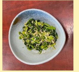
ほうれん草の胡麻和え・すき焼き風卵とじ・菜の花芝エビ